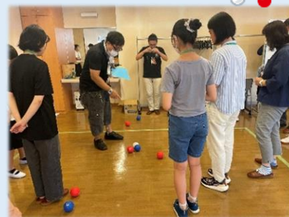
得点の数を教わり中

夏季休暇を活用してボランティアの体験をしてもらおうと、小学生から大学生を対象としたボランティア体験講座を実施しました。7月31日のオリエンテーションでは、ボランティアに参加する上での心がまえや気を付けることなどを学んだほか、参加者全員でポッチャを行いました。ポッチャでは、学生さん、保護者の方、障害当事者の方、職員など全員が夢中になり、参加者同士声を掛け合い大変盛り上がりました。