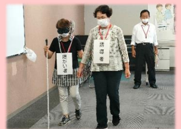
昨年の誘導法の様子