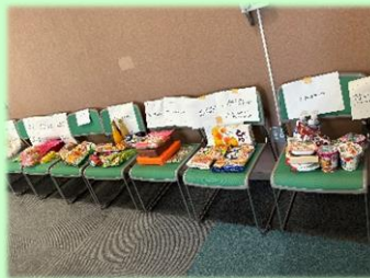
配分先へ分けていきます