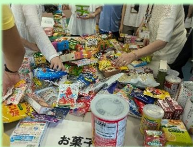
種類ごとに分類します