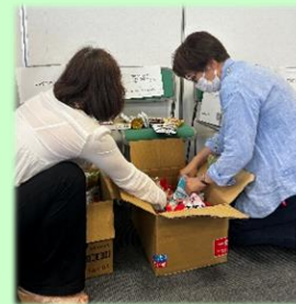
配分した食品を梱包します