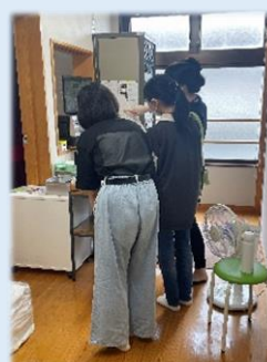
お名前・曲名のアナウンス